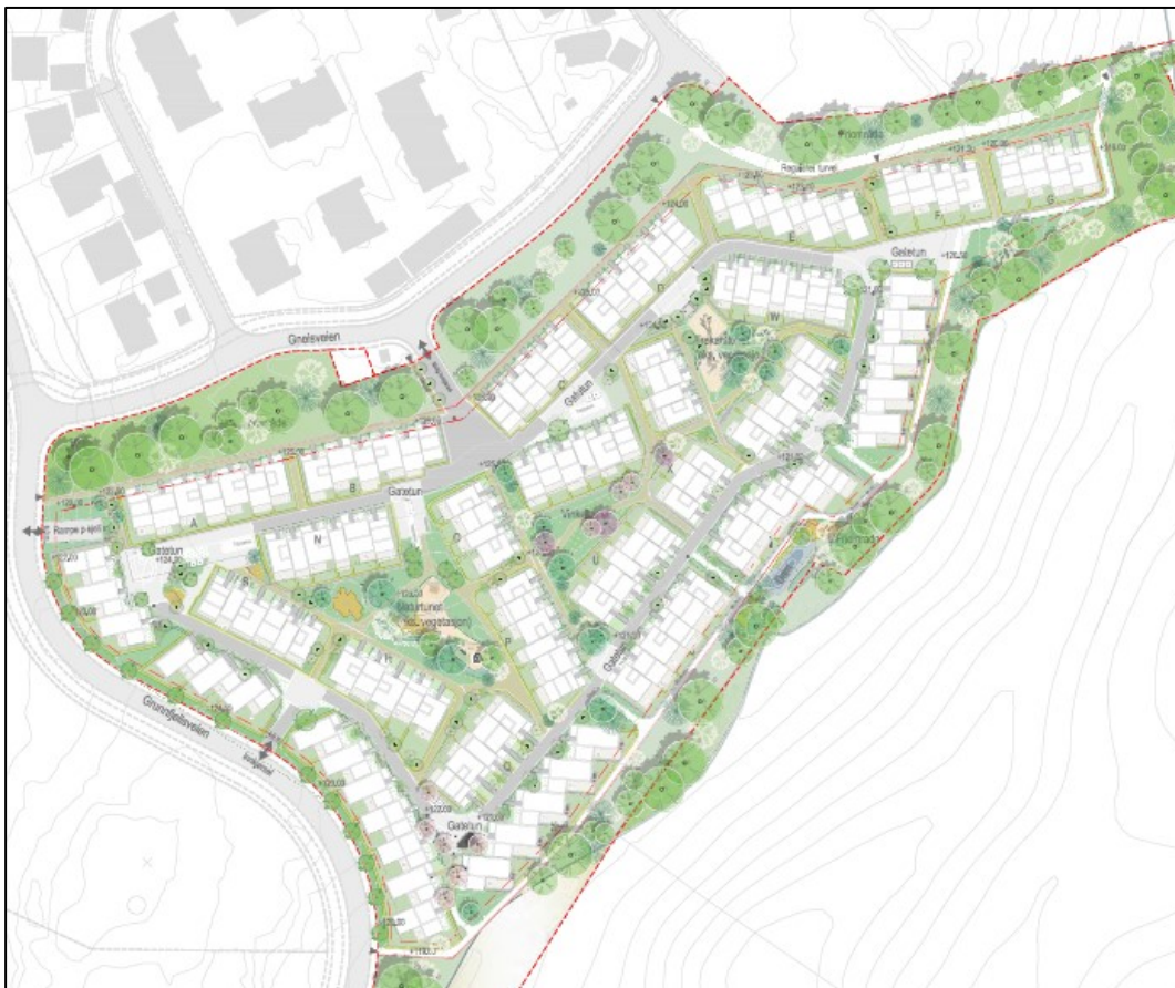
Figur 3: Utsnitt av forslag til illustrasjonsplan